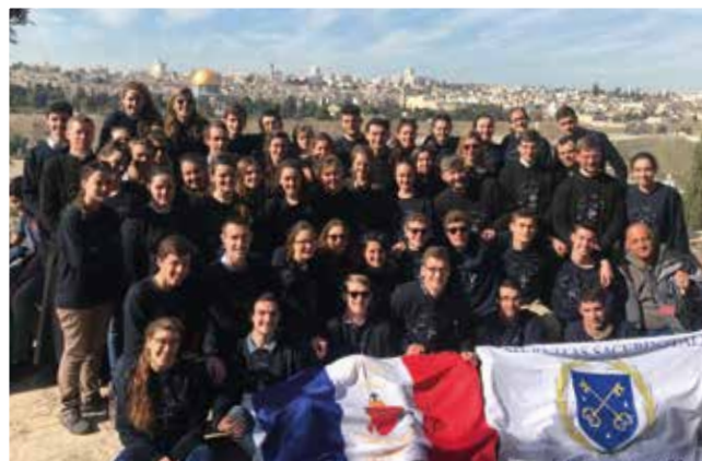
Les jeunes de Versailles en Terre Sainte.