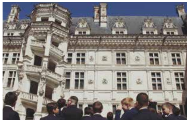
Les élèves de l'Institut-Croix-des-vents à la découverte de la Renaissance.