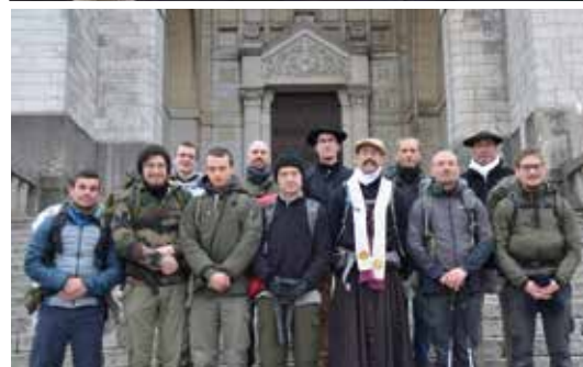
Retraite esto vir vers les hauteurs!