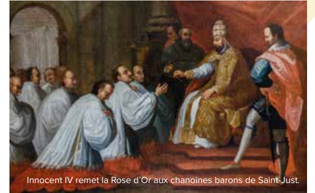
Innocent IV remet la Rose d'Or aux chanoines barons de Saint-Just.

La collégiale Saint-Just à Lyon a une histoire riche, liée à celle de la France et de l'Église.