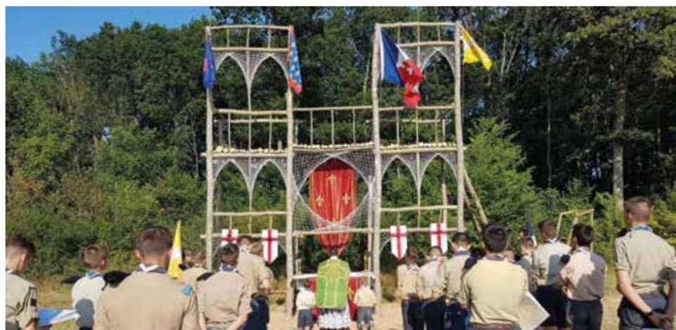
Le mât des couleurs des scouts du Mans en hommage à Notre-Dame-de-Paris.