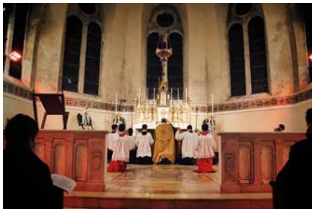
▲ Visite de Monseigneur Feuillet, nouvel évêque de Séez, à l'Institut Croix-des-Vents.