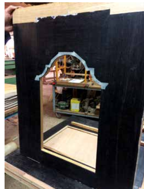
▼ Les travaux pour le nouveau tabernacle de l'église Saint-Bruno de Bordeaux progressent.