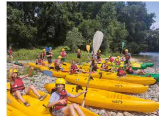
La Colonie Fra Angelico