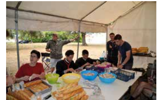
L'intendance au Camp Notre-Dame de Grâce