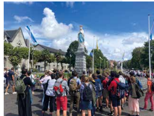
La Route Saint-Pierre à Lourdes