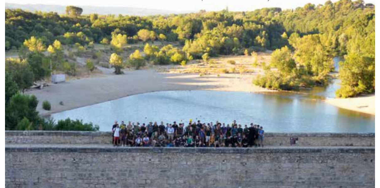
Le Raid Saint-Michel entre Montpellier et Castelnaudary