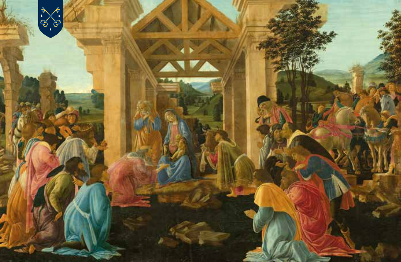
Sandro Botticelli - L'adoration des mages (1480)

il « grandissait et se fortifiait, tout rempli de sagesse, et la grâce de Dieu était sur lui » (Lc 2,40).