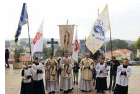
Pèlerinage à Saint-Michel-Mont-Mercure (Vendée) le 21 septembre 2024