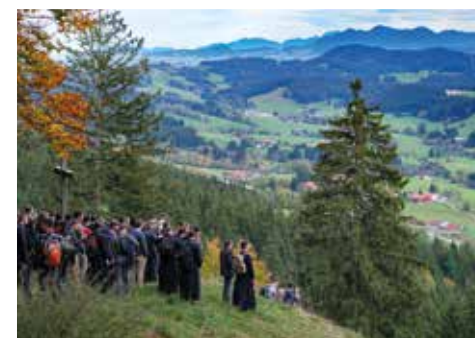
Excursion du séminaire à Weitnau le 13 octobre 2024