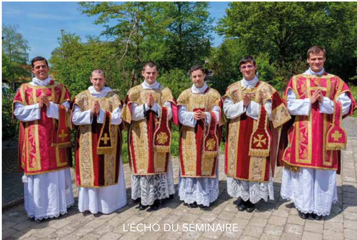
L'ÉCHO DU SÉMINAIRE