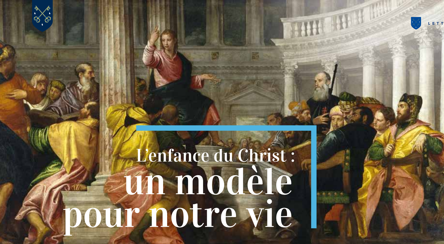
Paolo Véronèse - La dispute avec les docteurs du Temple (vers 1560)