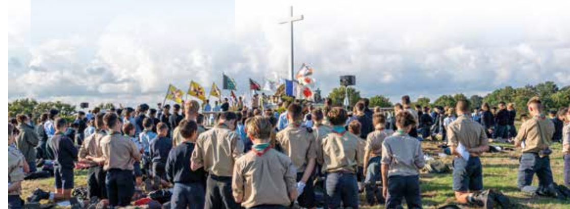
L'apostolat de Nantes en pèlerinage à Loublande le 22 septembre 2024