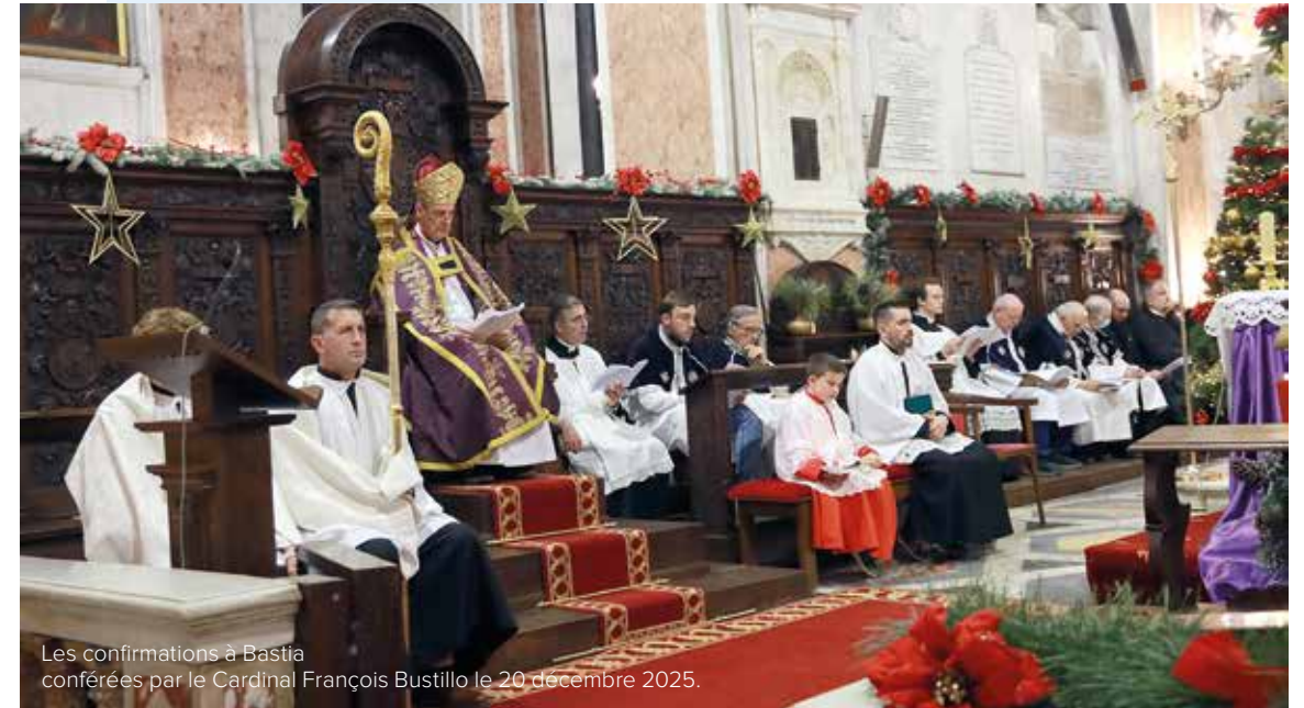
Les confirmations à Bastia conférées par le Cardinal François Bustillo le 20 décembre 2025.